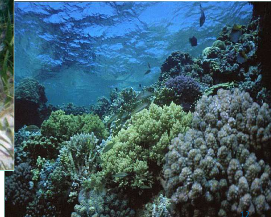
Recifes de Corais